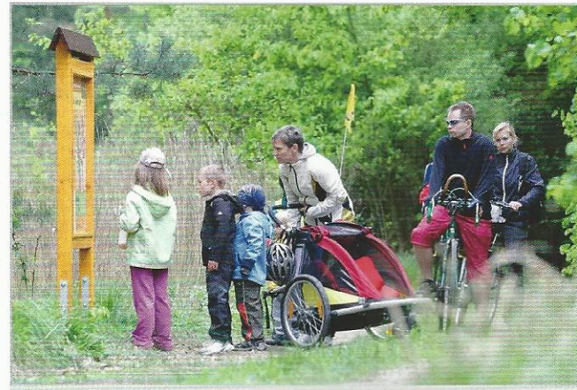
Naučné stezky přitahují děti i dospělé

Vedle individuální návštěvnosti jsou lesy využívány i pro konání